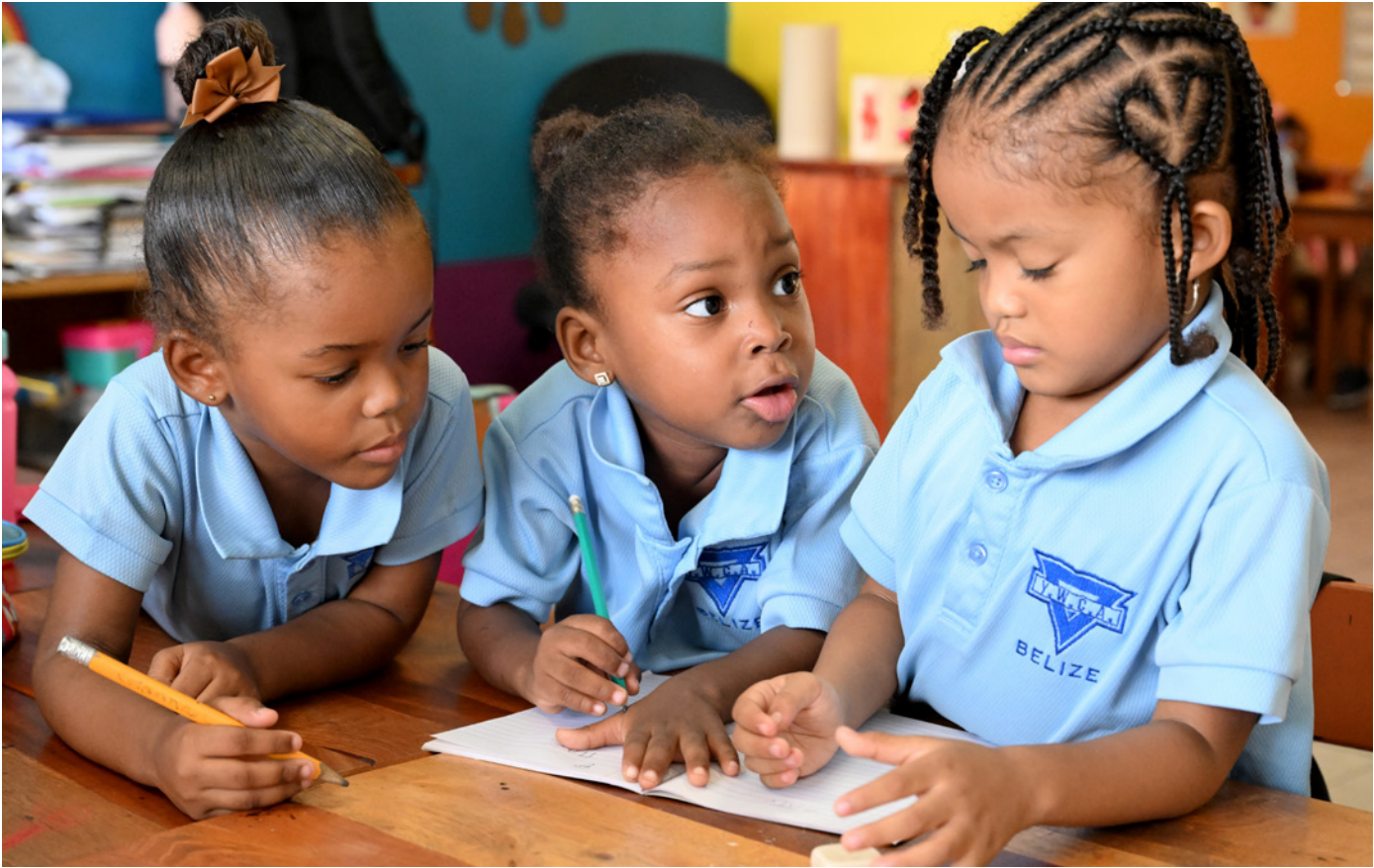
Belize, 2024

Long-standing learnings from existing national development policies and solid rigorous evidence developed across regions and contexts have given us a clear indication of what works for children. The challenge is how to best support policymakers in how they prioritize these policies and commit to their realization, while addressing challenges that impede investments at scale. In this process, identifying interventions and policies impacting multiple child outcomes can be a game changer for accelerating progress ■