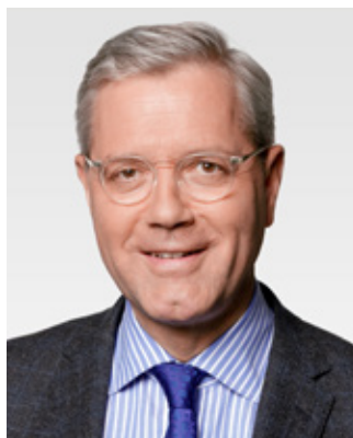
dr Norbert Röttgen, CDU/CSU Przewodniczący Komisji Spraw Zagranicznych

„Odzwierciedleniem wzrostu odpowiedzialności Niemiec na arenie międzynarodowej jest rosnące zainteresowanie opinii publicznej sprawami polityki zagranicznej – i to dobrze, gdyż tylko przy akceptacji obywateli i obywateli nasz kraj będzie mógł w przyszłości sprostać tej odpowiedzialności. Komisji Spraw Zagranicznych Bundestagu przypada przy tym znacząca rola. Do jej zadania, krytycznej obserwacji i współdziałania w realizacji polityki zagranicznej rządu federalnego, należy umożliwienie obywatelom zabierania głosu w ramach procesu decyzyjnego w kwestiach polityki zagranicznej, mającego z reguły charakter poufny, jak również branie pod uwagę pytań i wątpliwości wyartykułowanych przez obywateli.“