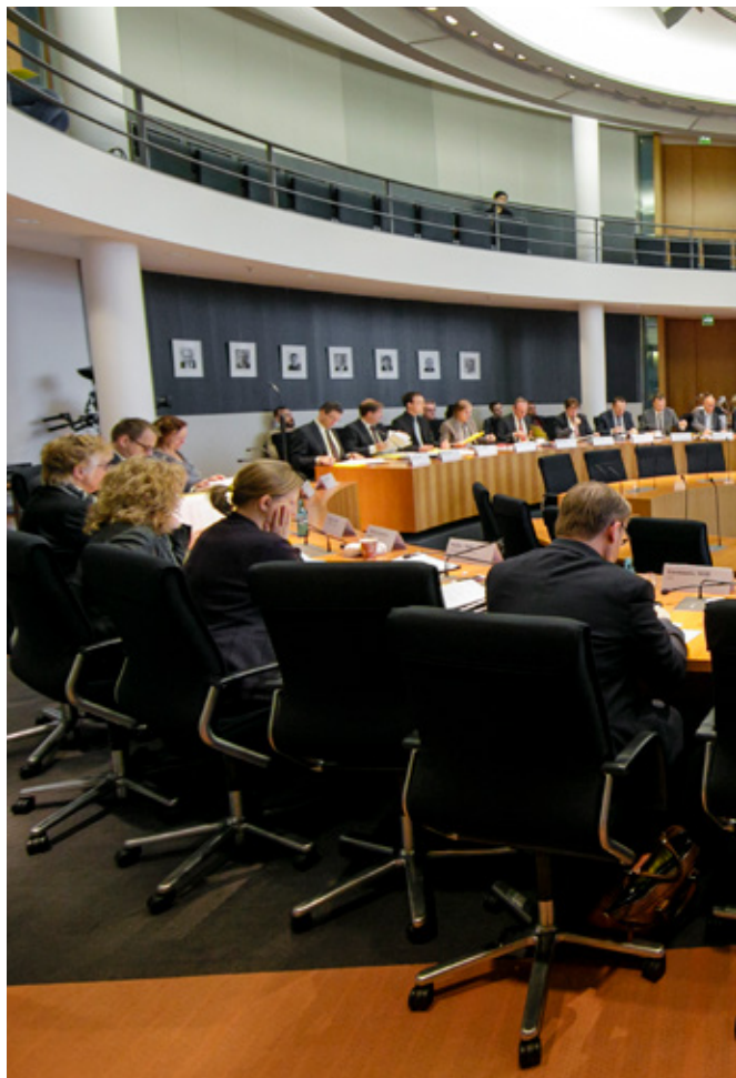
Las comisiones del Bundestag sesionan en las salas de reuniones del Edificio Paul Löbe.