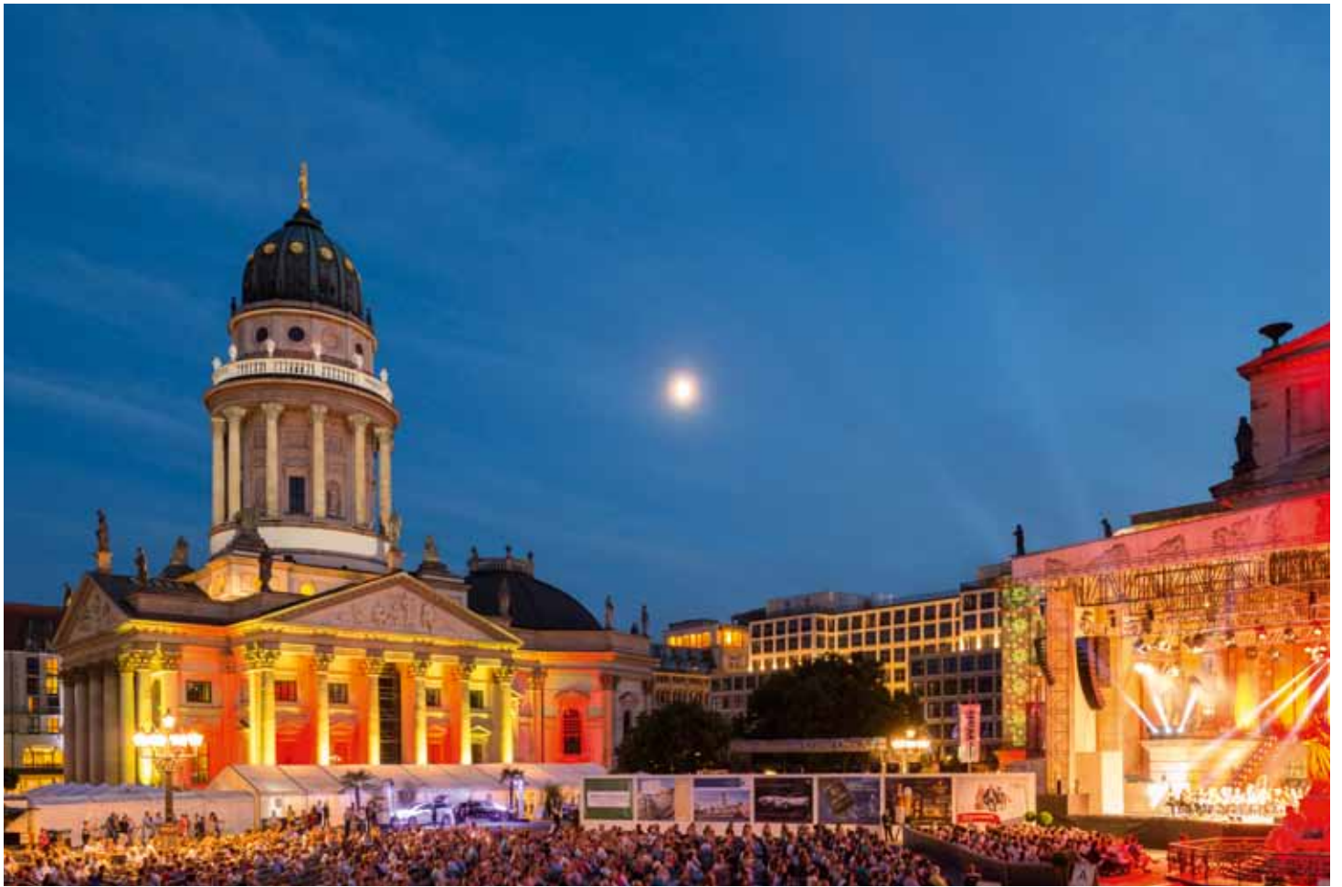
La Deutscher Dom en el Gendarmenmarkt de Berlín, iluminada con motivo del 23.º Clas- sic Open Air Festival en julio de 2014.