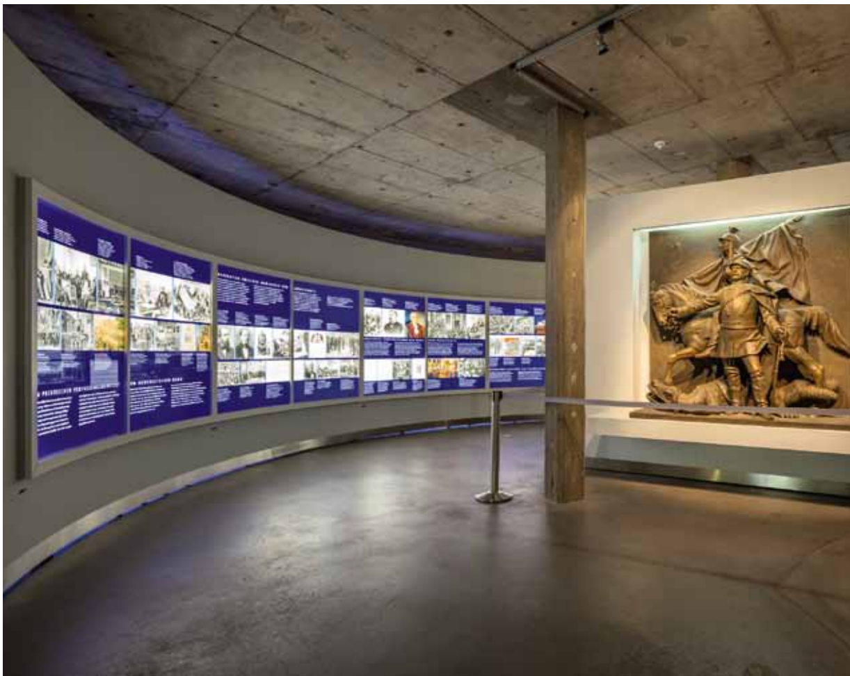
Antiguo monumento de Bismarck en Francfort del Meno: El artista Peter Cragert creó esta escultura en 2001 basándose en documentos fotográficos; al fondo paneles dedicados al bloque temático “Del conflicto constitucional prusiano a la Primera Guerra Mundial”.