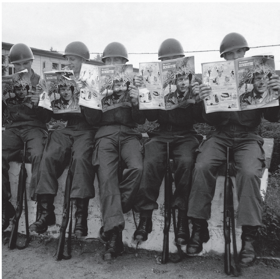
Начальные годы парламентской армии: молодые солдаты через год после создания Бундсвера в 1955 году читают газету Министерства обороны «Die ersten Schritte (Первые шаги)»