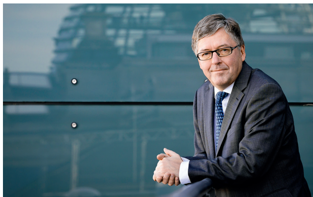
Ганс-Петер Бартельс, Уполномоченный по делам военнослужащих Германского Бундестага

Предлагаемая брошюра рассказывает об обязанностях и задачах Уполномоченного по делам военнослужащих, а также о тех людях, которые до сих пор занимали эту должность. Кроме того, она дает обзор развития должности Уполномоченного по делам военнослужащих, его полномочий и обязанностей, а также правовых основ.