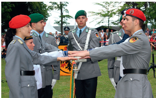
Гражданки и граждане в военной форме: военнослужащие Бундесвера приносят военную присягу

Вместе с тем внутреннее руководство не исчерпывается конкретным применением действующих предписаний. Это в особой мере касается также отношения начальников к своим подчиненным в повседневной военной службе. Начальники должны управлять своими подчиненными не только следуя букве закона, но и «душой и разумом». Несущий службу в вооруженных силах, как гражданин в военной форме, должен быть свободной личностью, человеком, действующим как ответственный гражданин и проявляющим постоянную готовность к выполнению задания. От него требуется не слепое повиновение, а повиновение, основывающееся на понимании.