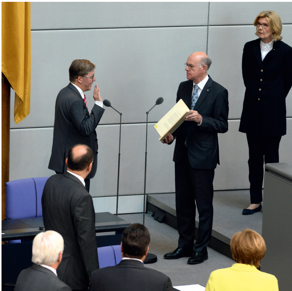
«Проявлять справедливость по отношению к каждому»: новый Уполномоченный по делам военнослужащих Ганс-Петер Бартельс (слева) приносит присягу перед Президентом Бундестага Норбертом Ламмертом (ХДС/ХСС) и Бундестагом