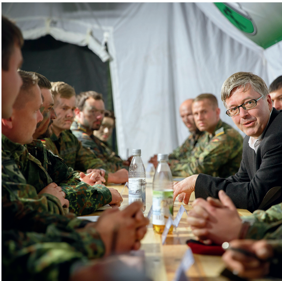
Беседа с доверенными лицами: Уполномоченный по делам воен- нослужащих Ганс-Петер Баргельс (справа) при посещении войск германского боевого соединения NATO Response Force в 2015 году на учебном военном полигоне в Мюнстере